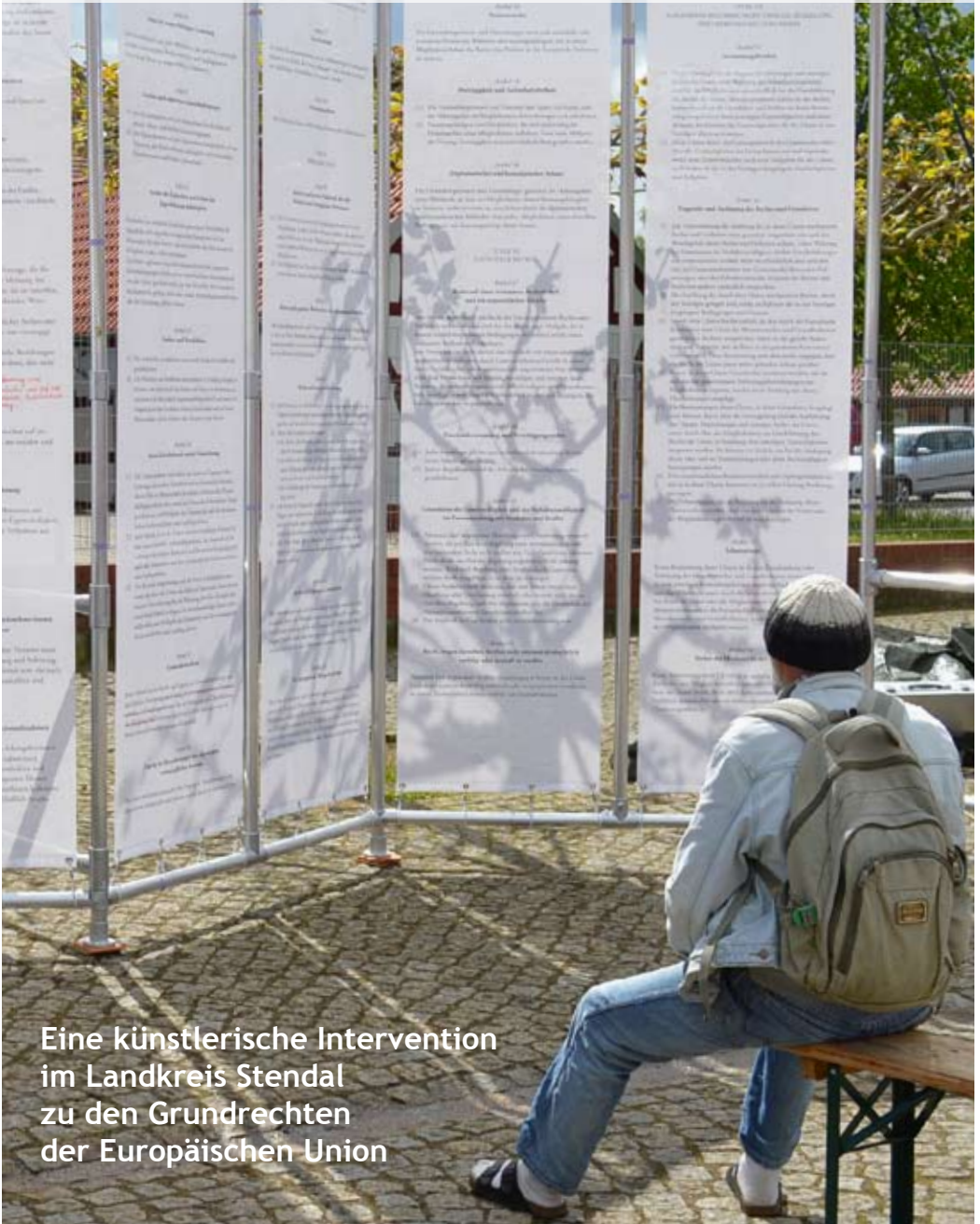
Eine künstlerische Intervention im Landkreis Stendal zu den Grundrechten der Europäischen Union