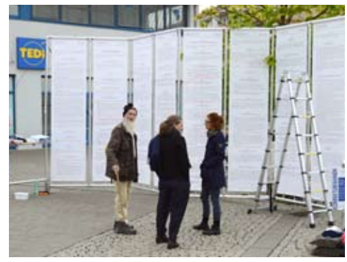
Stendal, Stadtsee Platz